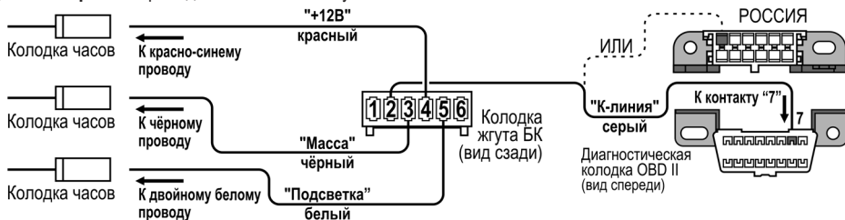
Рис.2 Схема подключения БК