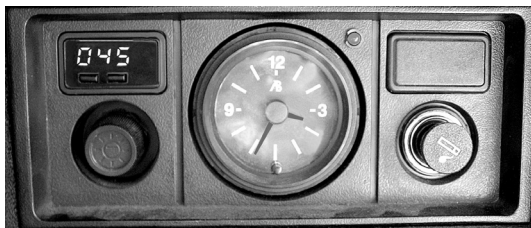
Рис.1 Вид установленного БК в консоли а/м ВА3 2107

Соедините чёрный провод "Масса" из жгута БК