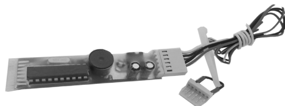
рис.3 Бесключевой обходчик иммобилайзера